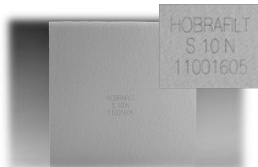
Obr. 2. Výstupní strana filtrační desky