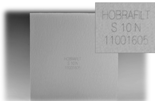
Obr. 2. Výstupní strana filtrační desky